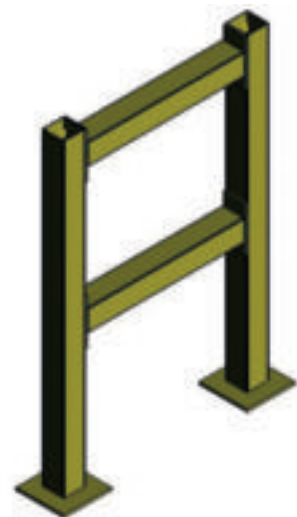
Soutènement spécifique en siFramo

Depuis la version 2017_5, SiCAD4TRICAD MS offre un accès limité aux modules Heizung 3D (chauffage), Sprinkler 3D (gicleurs) et Piping 3D (tuyauterie) à tous les utilisateurs de TRICAD. Pour améliorer l'utilisation, des patches sont nécessaires pour cette version. Ceux-ci sont intégrés à partir de la version 2018_0.